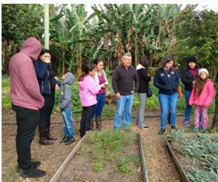
passeio em horta