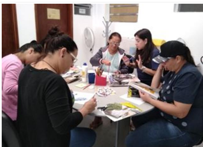
Of. Fortalecimento de Vínculos