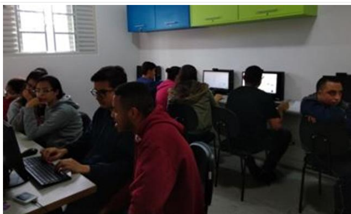
Mundo do Trabalho