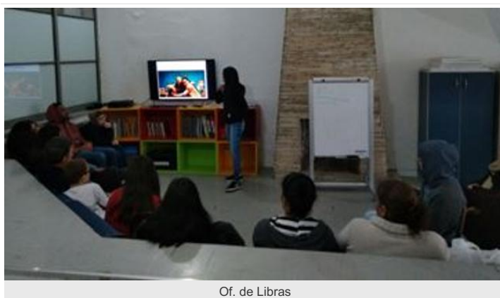
Of. de Libras