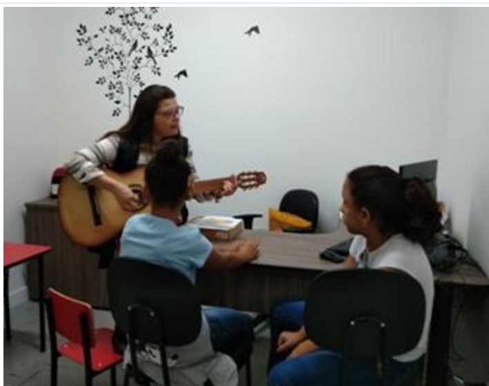
Of. Comunicação Oral