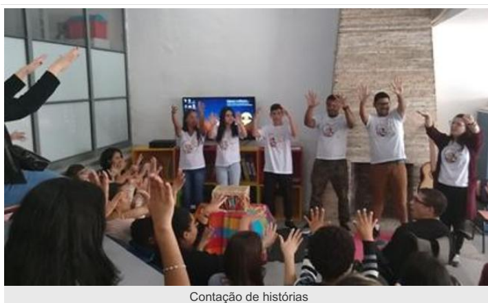
Contação de histórias