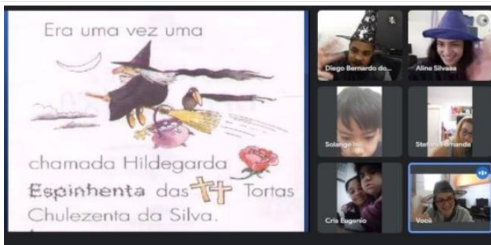
Atividade de oficina de convivência virtual