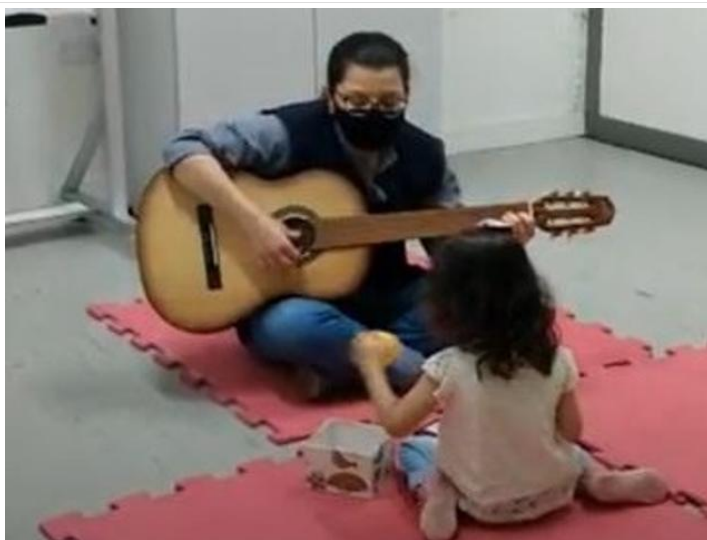
Atividade de oficina de comunicação oral