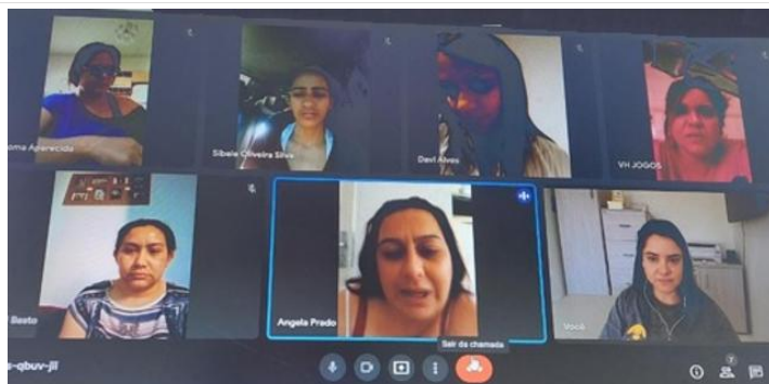
Grupo de pais em Oficina virtual de fortalecimento de vínculos