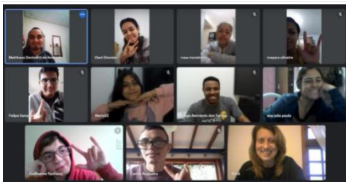
Atividade virtual em grupo com jovens de Preparo para o Mundo do Trabalho