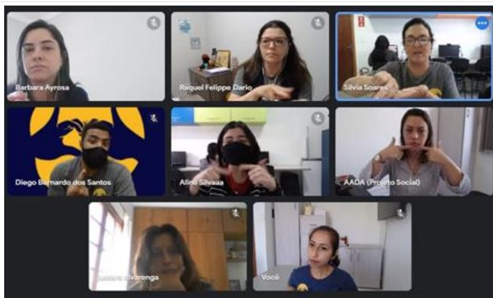
Reunião remota de equipe técnica