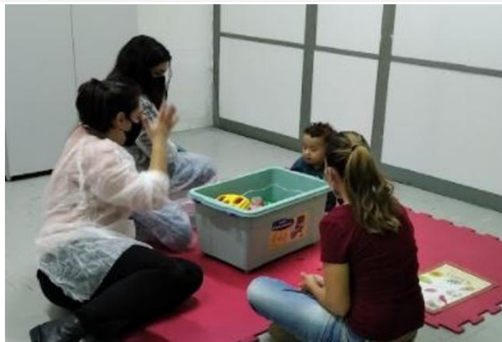
Atendimento de família de acompanhamento com atividade de oficina