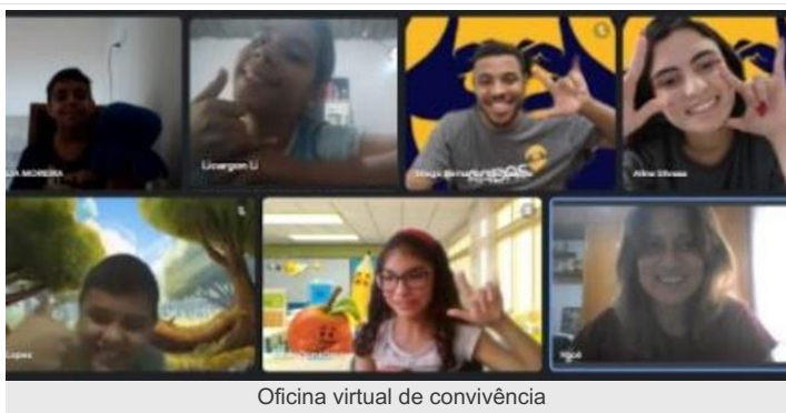
Oficina virtual de convivência