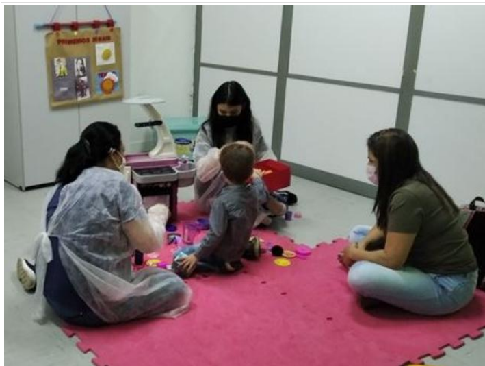
Atendimento de família de acompanhamento com atividade de oficina