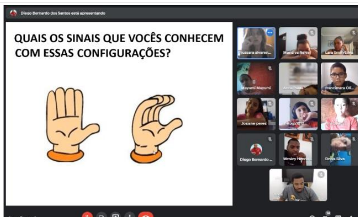
Atividade de oficina de convivência virtual