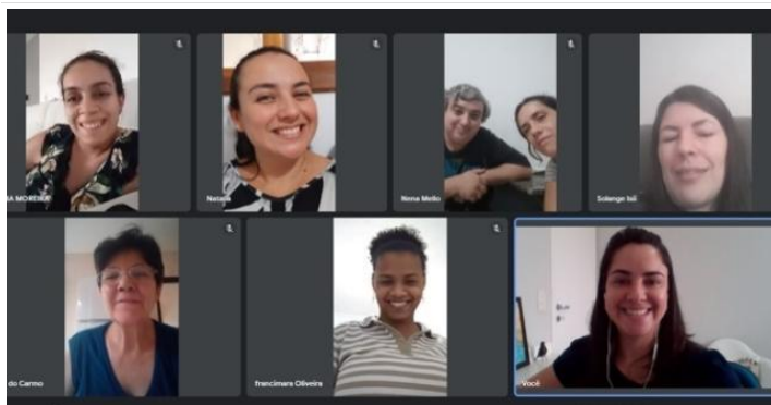
Grupo de pais em Oficina virtual de fortalecimento de vínculos