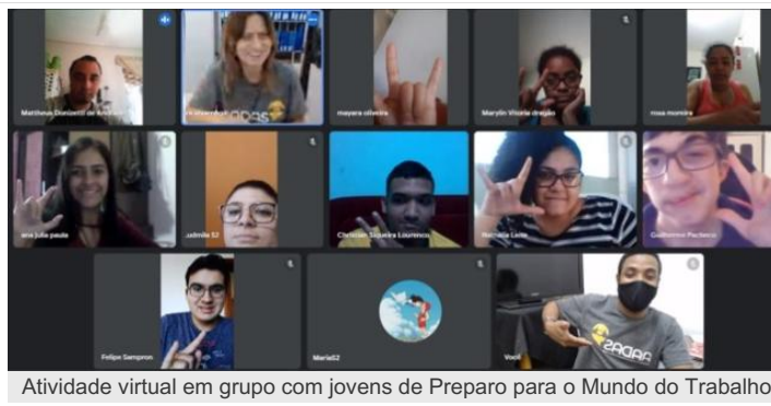
Atividade virtual em grupo com jovens de Preparo para o Mundo do Trabalho