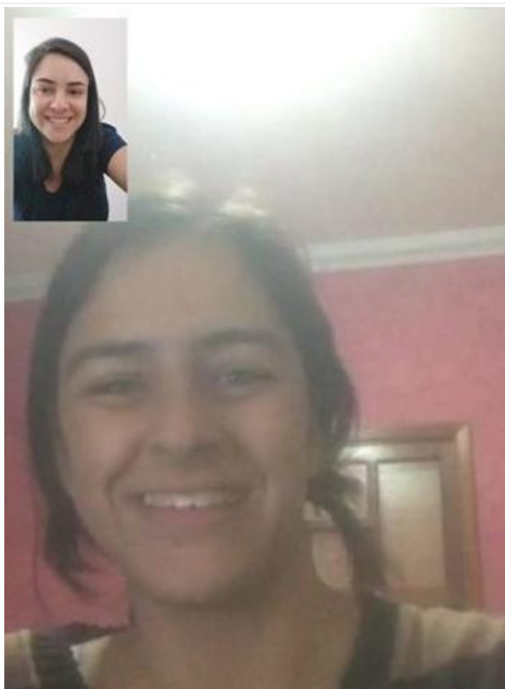
Intervenção psicossocial remota