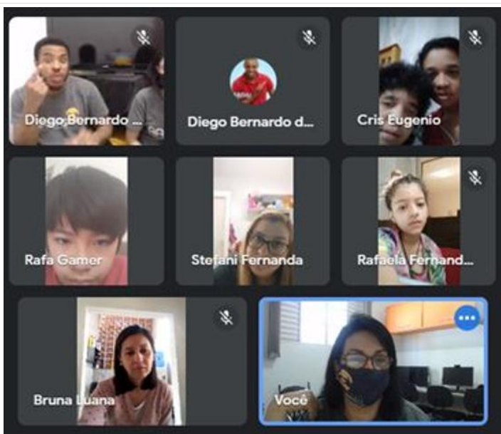
Oficina virtual de convivência