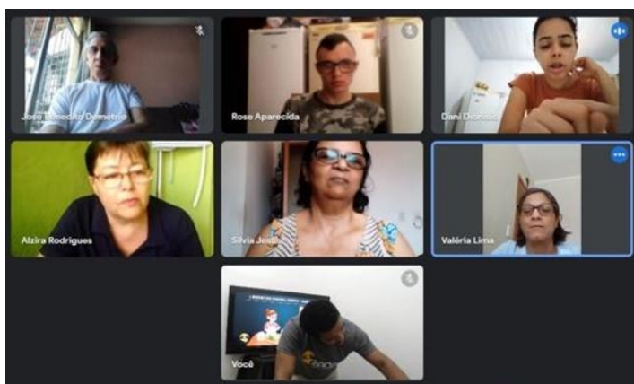
Oficina de Libras remota