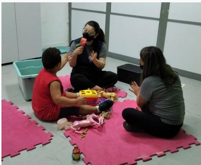
Atividade de oficina de comunicação oral da fono com usuário e família