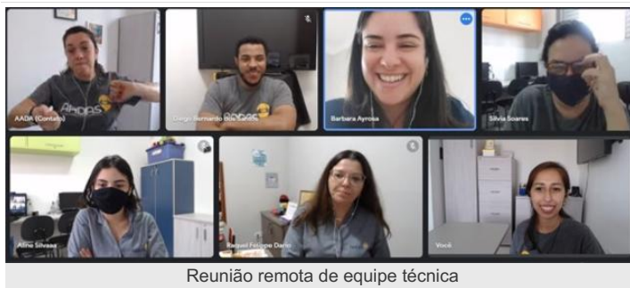
Reunião remota de equipe técnica