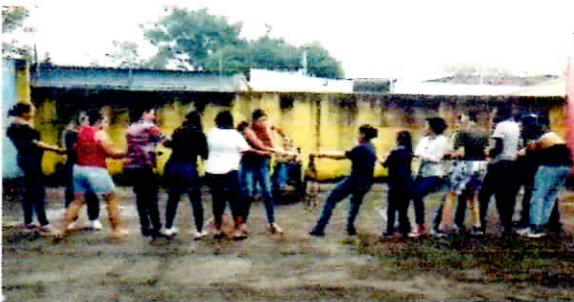
Atividade de A.C.E.L.