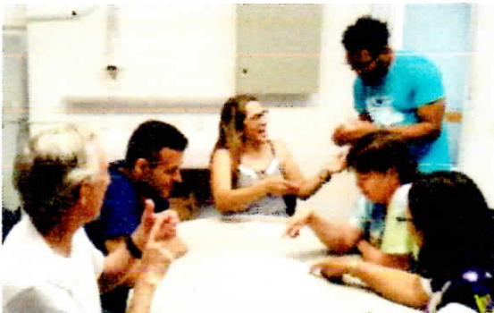
Oficina de LIBRAS