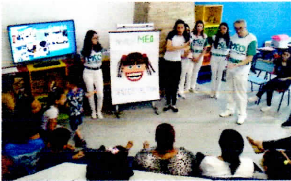
Atividade de socialização em oficina.