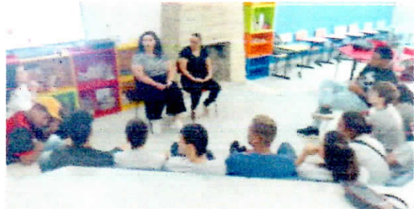
Jovens em atividade de mundo do trabalho.