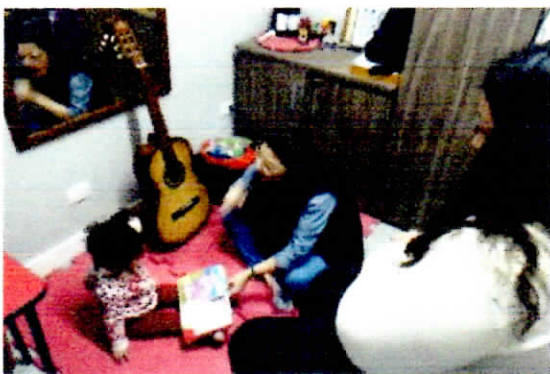
Acompanhamento com a fonoaudióloga à usuária e família.