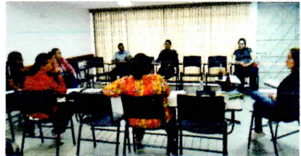
Fortalecimento de vínculos com grupo de pais.