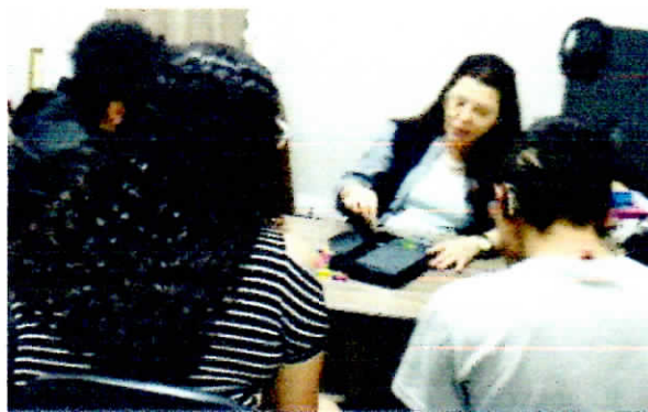
Trio em oficina de comunicação oral.