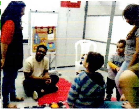
Atividades de oficina de convivência em acompanhamento precoce.