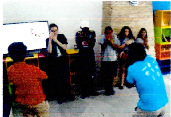
Oficina de convivência com comunicação em Libras