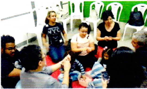
Atividades de oficina de convivência em acompanhamento precoce.